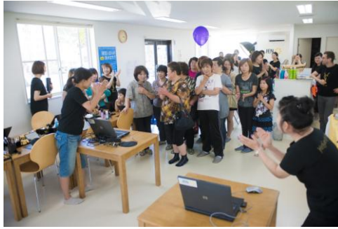
クイズ大会では、皆さん真剣です