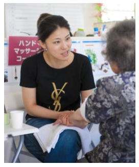
ハンドマッサージ中は話が弾みます

HANA 荘は、地域の復興・再生を目的に日本ロレアルにより昨年11月に建設され、特定非営利活動法人 JEN が管理運営しています。営業は、毎日 10 時から 16 時(休日、祝日含む)まで行い、約 50 名収容できます。また、地域で被災された方を採用し、雇用面でも支援していきます。開設以来、自治会の会合や地域の人の憩いの場、復興の拠点として地域に定着してきており、集会施設や遊び場としての機能のほか、手芸、ヨガ講座など、地域の方々の様々なニーズを取り入れながら活動しています。また今年3月からは、中高生を対象とした、学びとカウンセリングの場「希望のゼミ」を開設、現地のニーズを反映し、毎週土曜・日曜の週二回、開講しています。HANA 荘の訪問人数も平均して毎月 500 人を超え、地域の皆さんに活用していただいています。