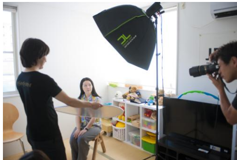
メイク後のプロのカメラマンによる撮影風景