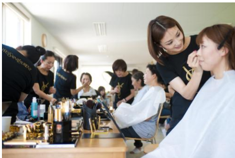
メイクアップアーティストによるメイクは大人気！

6月29日には、日本ロレアルが建設、サポートをしている地域の人たちが集う場所、コミュニティカフェ“ はなそう HANA 荘”(敷地:330㎡、建物:80㎡ 住所:鹿妻南1-9)にて、日本ロレアルが有する人気の高級ブランド「イヴ・サンローラン・ボーテ」のメイクアップアーティストが、お似合いのカラーをご提案しながら、コミュニティの皆さんのメイクをしました。メイク後は、プロのカメラマンによる撮影コーナーにて、記念撮影会を実施。「はじめてプロのカメラマンに撮ってもらった」、ご夫婦で来られた方は、「夫婦のよい記念になった」と大好評でした。また、ネイルやハンドマッサージコーナーでは会話も弾み、社員はコミュニティの皆さんとの交流を深めていました。日本ロレアルは、今後も、社員が参加するコミュニティ支援活動を実施してまいります。